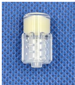
同梱廃止するインフュージョンプラグ

コネクタのISO規格変更に伴い、セットに含まれるインフュージョンプラグの同梱を廃止し、スタイレットが入っている送血側ルーメン用としてプラグを1個セットに同梱します。