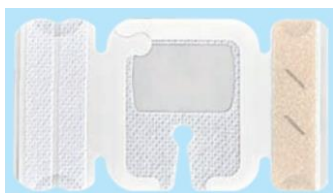
NSD10WAIVS1 (I字スリット、固定テープ2本)