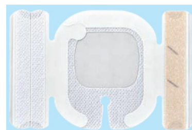
NSD10WAIVS4 (I字スリット、固定テープ2本)