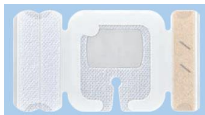
NSD10WAIVS3S (I字スリット、固定テープ2本)