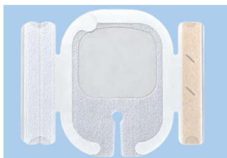
NSD10WAIVS5S (I字スリット、固定テープ2本)

ラインナップのすべての形状を掲載しておりません。 その他の品番、および製品の詳しい特長、形状については、別途カタログをご参照ください。