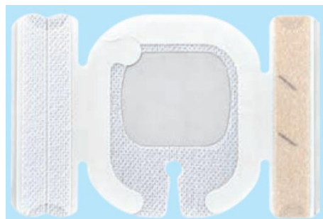
NSD10WAIVS4 (I字スリット、固定テープ2本)

ラインナップのすべての形状を掲載しておりません。 その他の品番、および製品の詳しい特長、形状については、別途カタログをご参照ください。