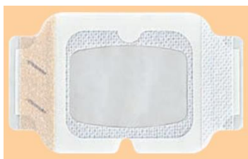
NSD10WAIVS2 (V字スリット、固定テープ1本)