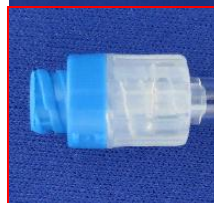
セーフタッチ®プラグ