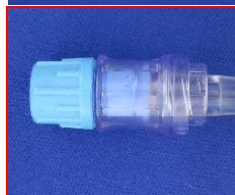
スワバブルストレートポート